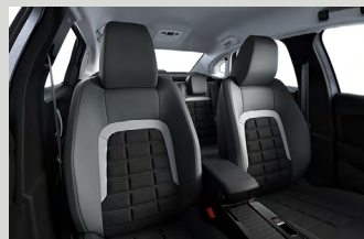
Urban Grey beltérhangulat (PLUS)