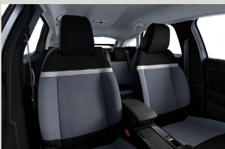
Standard beltérhangulat (YOU)

A C4X – felszereltségtől függően – a következő beltérhangulatokkal érhető el