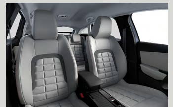
Alcantara Grey beltérhangulat (MAX-on opció)